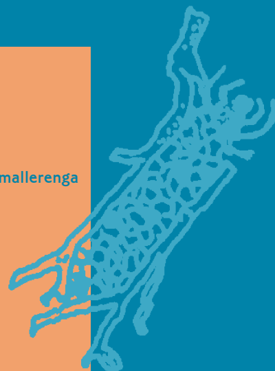
larva de tricòpter

La pineda de pi roig El cant del gaig, la merla, la mallerenga i el pit-roig La cinglera Les cireres d'arboç Les maduixes de bosc El sauló del camí Les castanyes La masia catalana El bosc de ribera Els animals d'aigua dolça Els gorgs La riera Major